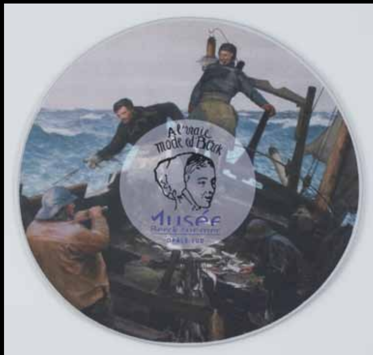
Le tapis de souris 4 euros