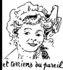
et terriens du pareil