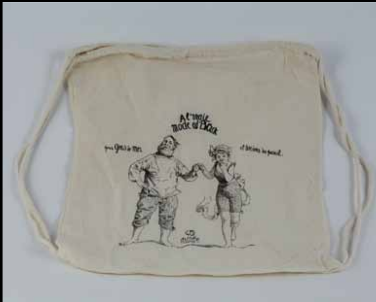
Les sacs coton 3 euros