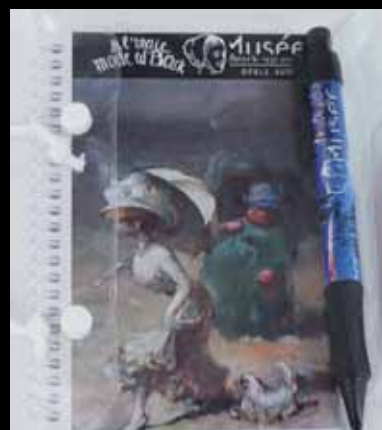
Le carnet et son stylo design 5 euros