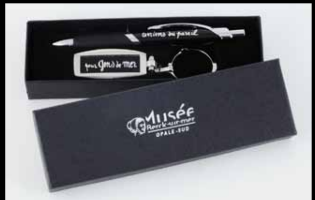
Le coffret stylo pour «gens de mer et terriens du pareil» 8 euros